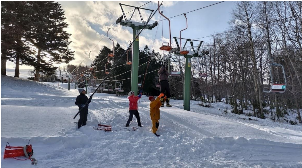
(北広島市消防署による救助訓練の様子)