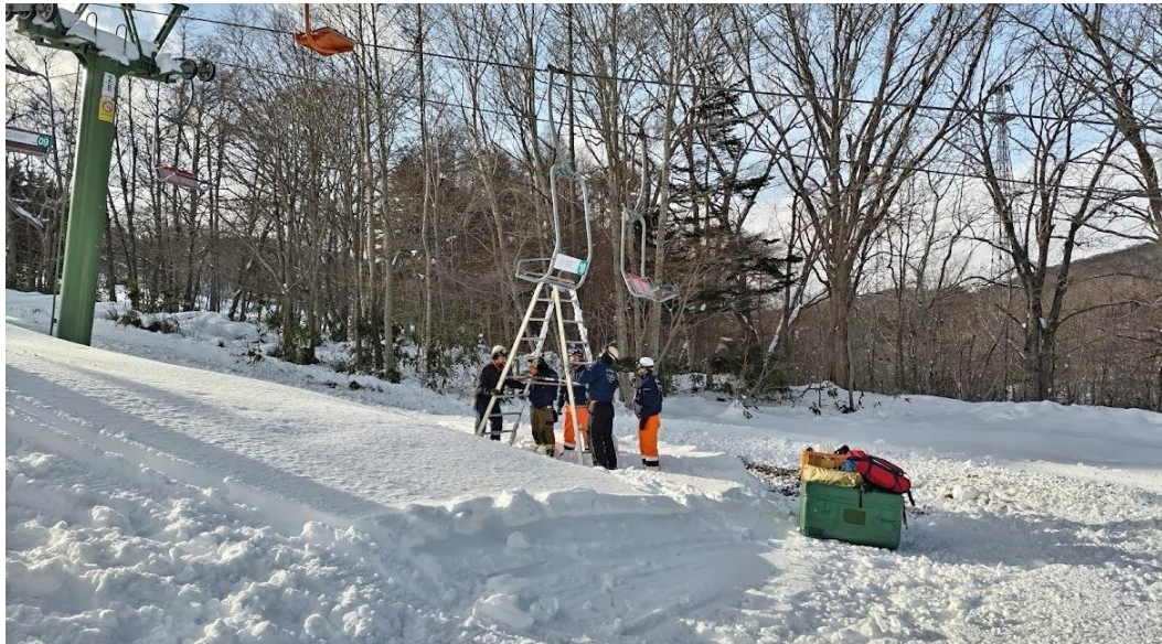
(第3ペアリフト地上高最高地点での救助訓練の様子)